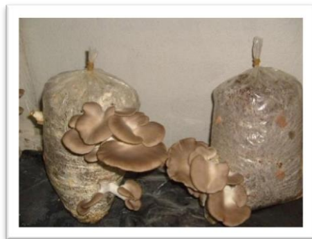
Figura 3. Pleurotus ostreatus . Cultivo bajo material compostado.