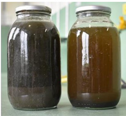
Imagen 2, mezclas número 2, tras la evaluación del tercer mes, donde se evidencian los cambios organolépticos visibles.

A partir de las comparaciones la mezcla 2 (Bacteria ácido láctica L.casei : 1 \times 10^3 cfu mL -1 , levadura Candida utilis : 2 \times 10^8 cfu mL -1 , actinomyces Streptomyces albus : 1 \times 10^6 cfu mL -1 ) fue la mejor concentración para el tratamiento de aguas residuales porcícolas.