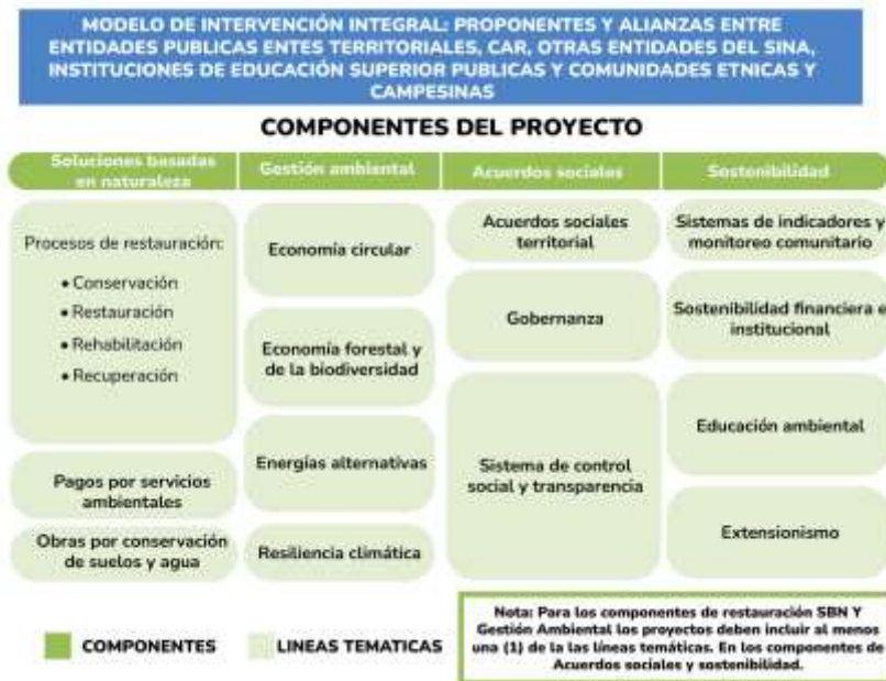
Figura 3. Modelo de intervención integral en los territorios